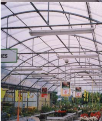
Lámina ONDEX R-101 y SSR-1 DA